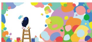
2026年カレンダー 8月 採用