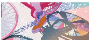
2026年カレンダー 7月 採用