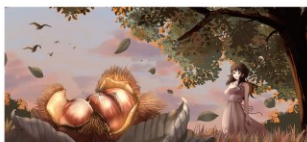
2026年カレンダー 11月 採用