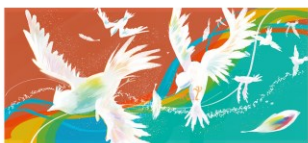
2026年カレンダー 4月 採用