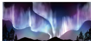
2026年カレンダー 12月 採用