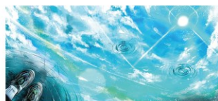
2026年カレンダー 6月 採用