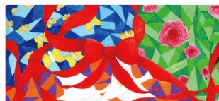
2026年カレンダー 3月 採用