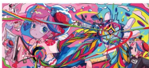
2026年カレンダー 10月 採用