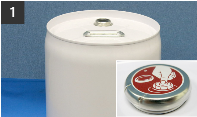
缶体と CAP を用意する