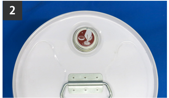
口金部に CAP をセットする