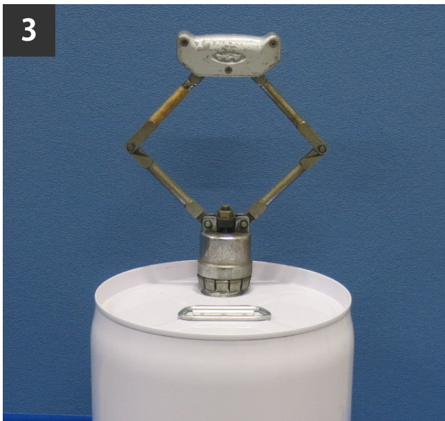
クリンパーを上から水平にあてがう