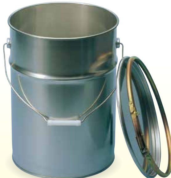
ステンレスペール缶