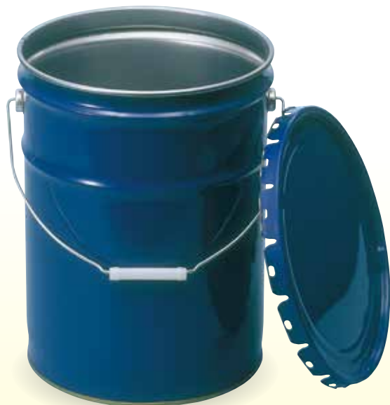
ラミネートペール缶