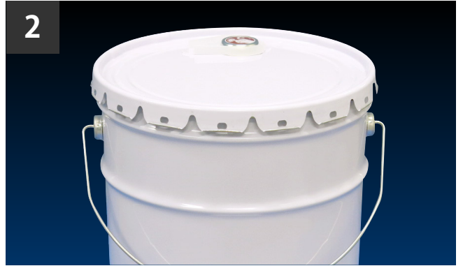
2 缶体に天板を水平にのせる。(CAP 付きタイプの場合は、CAP 位置を調整する)