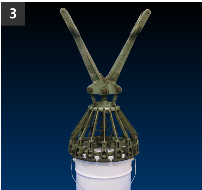
3 締め機を水平にあてがう