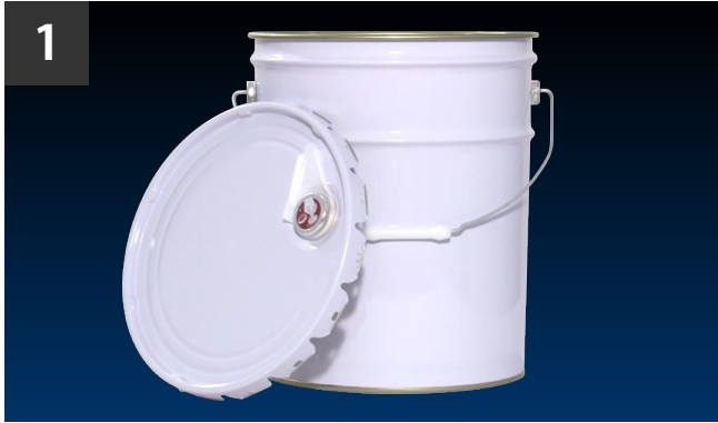
1 缶体と天板(フタ)を用意する